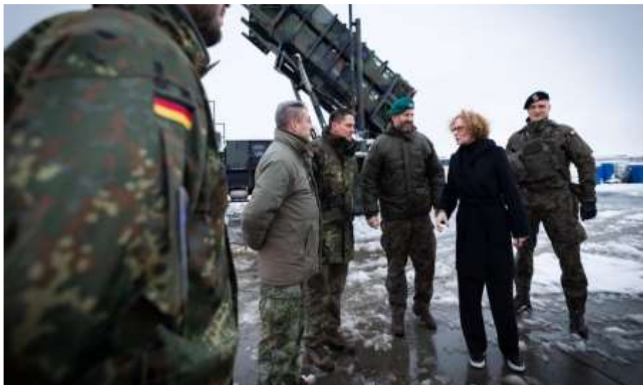
Gambar 3. Kunjungan Wakil Sekretaris Jenderal NATO ke Pusat logistik yang Menyediakan Peralatan Modern Penting Untuk Pertahanan Ukraina di Polandia dari NSATU