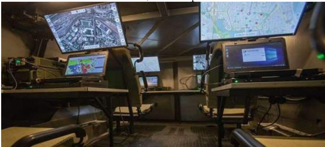
Gambar 2. Dokumentasi Pengembangan Kemampuan Di Bidang Komando, Kontrol, Komunikasi, Dan Komputer

terutama di domain komando-kontrol, komunikasi, dan informatika (C4) (Defense Express, 2022). Melalui MoA ini, NATO berkomitmen menyediakan perangkat komunikasi aman (secure communications equipment), layanan informasi modern, pelatihan teknis, serta konsultasi bagi Ukraina, memungkinkan militer Ukraina membangun jaringan komando-kontrol digital yang kompatibel dengan standar NATO. Berikut merupakan bentuk NATO berbagi pengetahuannya tentang praktik pengembangan kemampuan di bidang Komando, Kontrol, Komunikasi, dan Komputer (C4) :