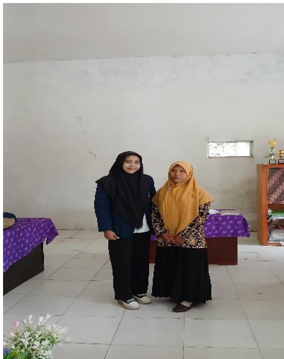
Gambar 2 Dokumentasi Bersama Guru IPS Kelas VIII MTS Mabdaul Falah

Peningkatan hasil belajar ini selaras dengan temuan dalam penelitian oleh Mulyani (2020) yang menyatakan bahwa media dokumenter dapat meningkatkan motivasi dan daya ingat siswa. Selain itu, Susilawati & Hendrawan (2022) juga membuktikan bahwa video pembelajaran berbasis documenter dapat memperkuat keterkaitan antara materi dan realitas sosial yang dipelajari.